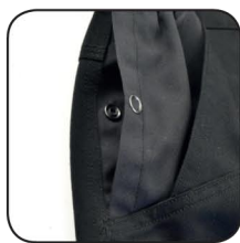
Poches avec passe-main