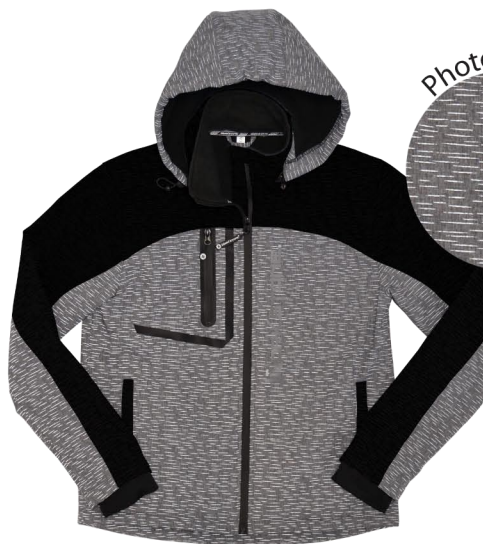
Matière grise entièrement rétro-réfléchissante