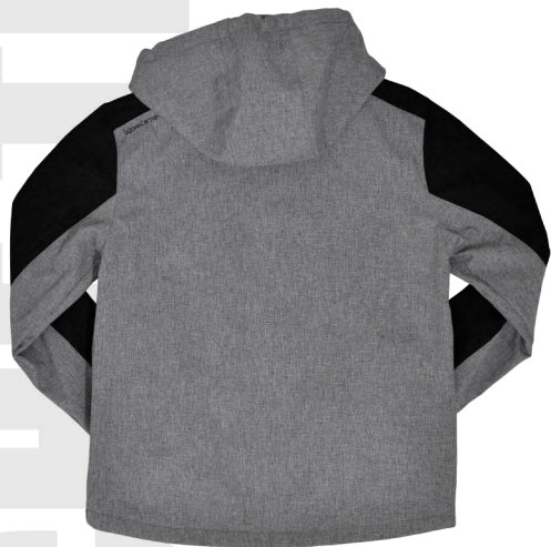
Vue de dos