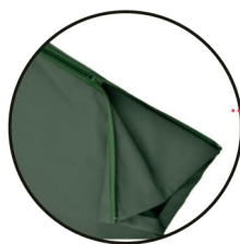
Bas de jambe zippé